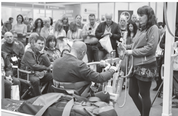
イギリス Naidex National