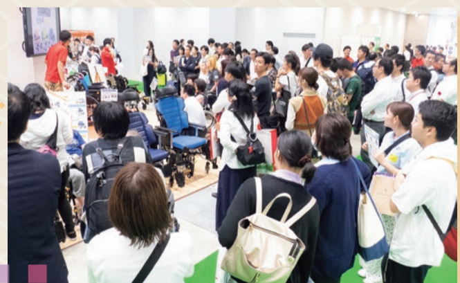
南展示ホールへのご来場者の様子